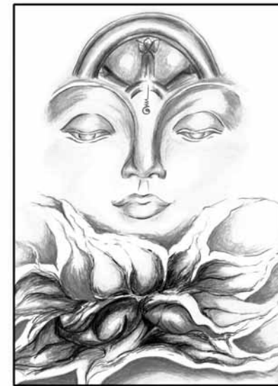
พระเทพสิทธิมนี (โชดก ป.๙)