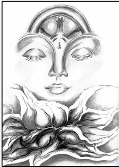
พระเทพสิทธิมนี (โชดก ป.๔)