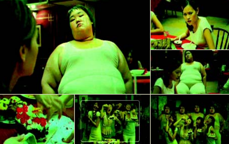
ภาพยนตร์โฆษณาภาพยนตร์เกาหลี

พอมานี้บุญส่งผล ทำให้ธุรกิจของผมเติบโตแบบทวีคูณมากกว่าเป้าที่ตั้งใจไว้เรื่อยๆ เติบโตเร็วมากถึง 100% คือสินค้าเราเป็นที่ต้องการมากจนขาดตลาด จนวันที่ 1 มกราคม 2551 เราต้องเปิดโรงงาน DK 2 ซึ่งใช้งบไป 200 ล้านบาท เพื่อผลิตให้ทันต่อความต้องการของลูกค้า และต่อมาระยะเวลาห่างกันเพียงแค่เดือนครึ่ง เราก็เริ่มก่อสร้างโรงงาน DK 3 ซึ่งจะใช้งบอีก 500 ล้านบาท และจะเป็นโรงงานที่ทันสมัยที่สุดแห่งหนึ่งของโลก โดยใช้เทคโนโลยีจากเยอรมัน สเปน