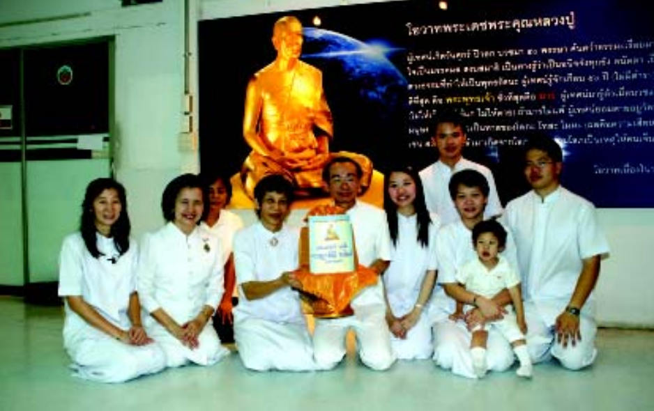
พาคครอบครัวมาสร้างบุญใหญ่ถวายปัจจัยร่วมหล่อรูปเหมือนทองคำหลวงปู่

สำคัญอย่างไร แล้วก็จะเกิดศรัทธาปฏิบัติธรรมตามอย่างท่าน จนเข้าถึงธรรม เมื่อถึงตอนนี้ ผู้หล่อยิ่งจะได้บุญไปอย่างท่วมท้น ได้บุญไปไม่รู้อีกเท่าไร ซึ่งวันหล่อหลวงปู่และวันทอดกฐินก็ใกล้เข้ามาทุกทีแล้ว ครอบครัวผมดีใจกันมากอยากให้ถึงวันนั้นเร็วๆ ส่วนผมและครอบครัวทำบุญล่วงหน้าไปแล้ว และถ้ามีเงินเข้ามาอีก ก็จะทำอีกไปเรื่อยๆ ซึ่งปกติครอบครัวผมจะประชุมกันในเรื่องบุญทุกวันเสาร์ต้นเดือน เพื่อร่วมกันอธิษฐานถวายกฐินรายวัน ซึ่งครอบครัวเราทำทุกเดือน และแจ่งข่าวบุญใหม่ๆ เพื่อ