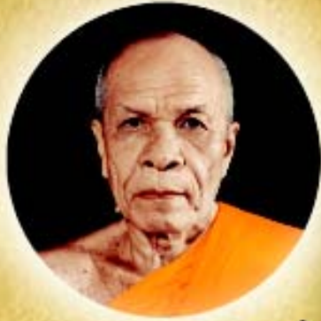
พระมงคลเทพมุนี